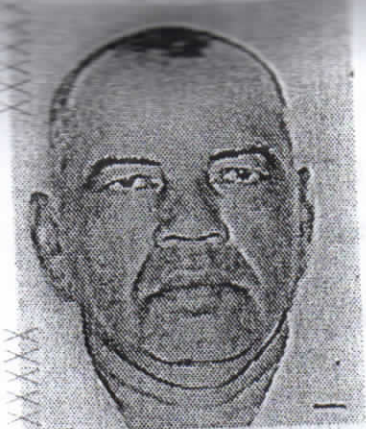
FIRMA DEL DIRECTOR GENERAL

C.S.E. CONSEJO SUPREMO ELECTORAL DE NICARAGUA